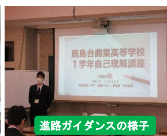
進路ガイダンスの様子